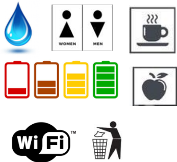
Удовлетворение витальных потребностей