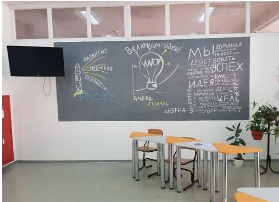
Меловая (грифельная) стена