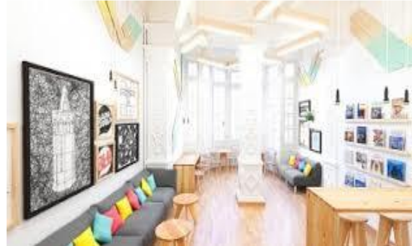
Зоны для творчества