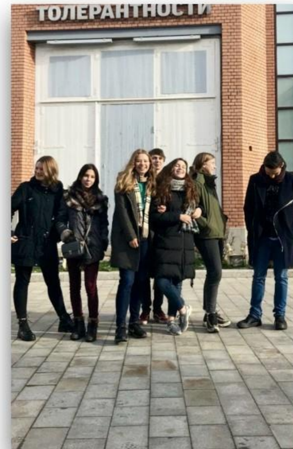
Юноши и девушки (10-11 класс, выпускники):