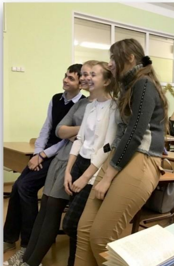
Подростки (5-7, 8-9 классы):