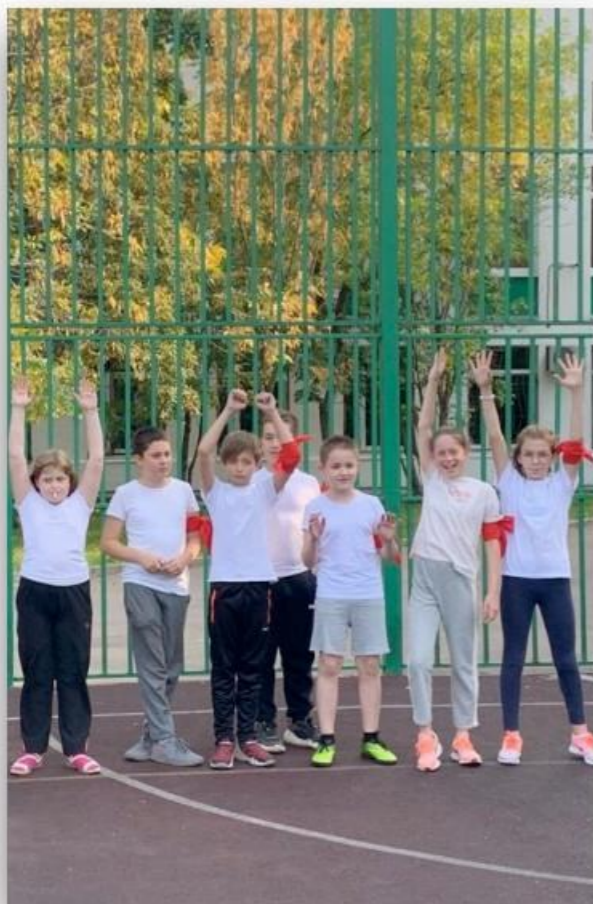
Младшие школьники (1-4 класс):