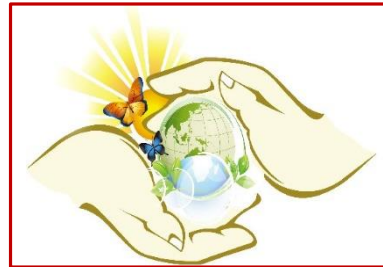
интеграция теории и практики