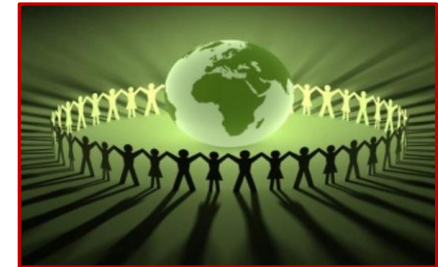
экологическая культура личности

осознание многообразных связей человека с окружающим миром